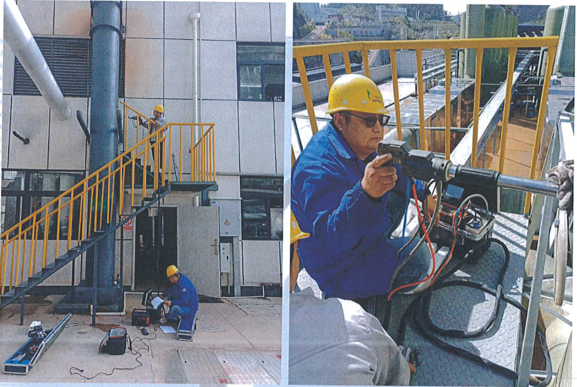
图7-2 部分现场采样图片