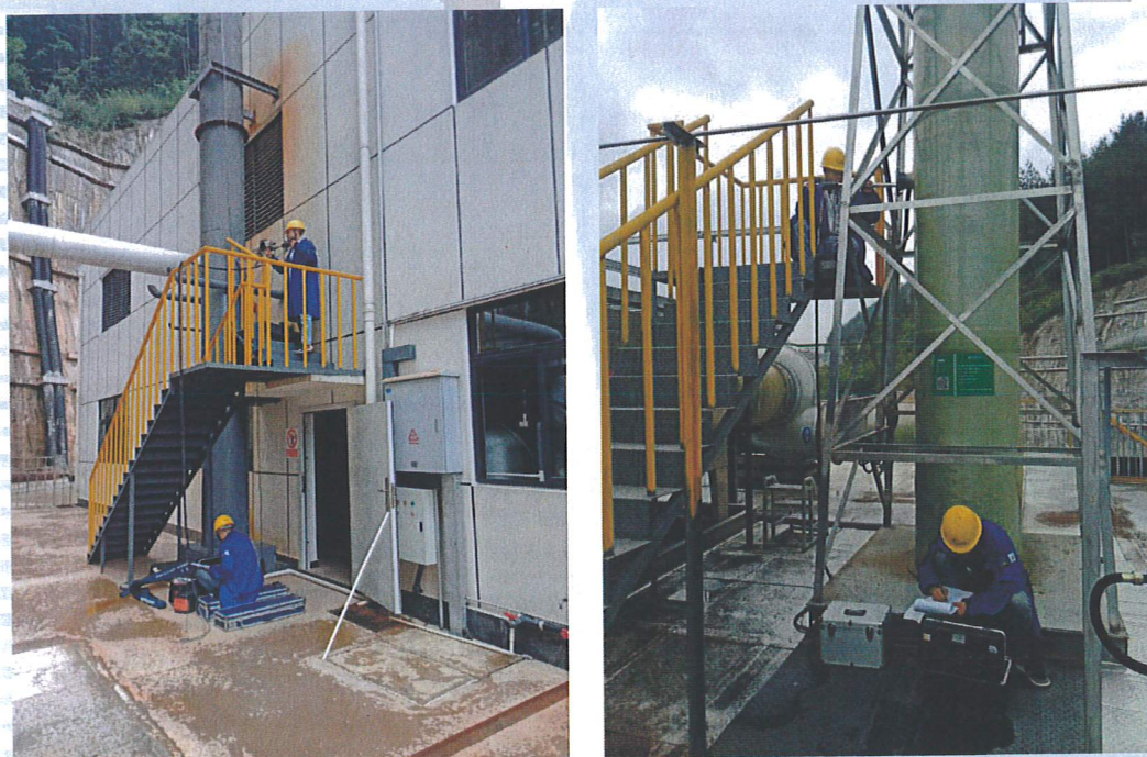
图7-2 部分现场采样图片